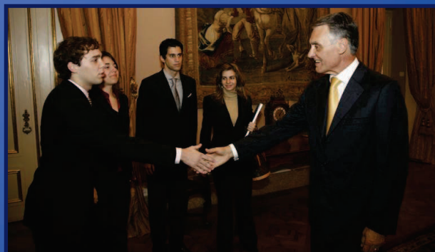
Encontro da AIESEC Portugal com Sua Excelência, Presidente da República, Cavaco Silva – Alumnus da AIESEC Portugal